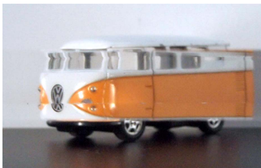
磨き有り：切断面を研磨機で磨く加工です