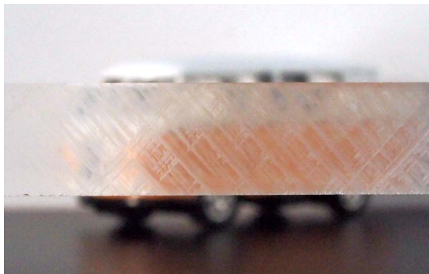
仕上げ無し：切断したままの状態です